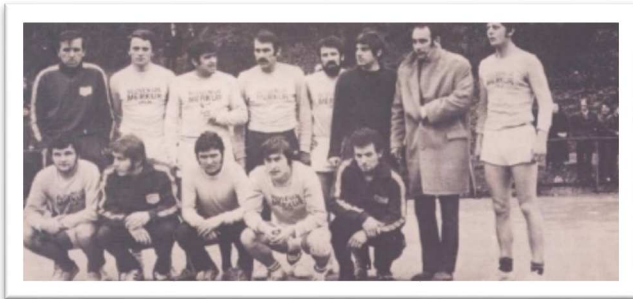
Slika 5: Ekipa Celja, ki je nastopala v I. zvezni ligi

Rokomet je bil najbolj razširjen šport v Sloveniji. V 107 klubih oziroma 177 ekipah ga je igralo več kot 3.200 aktivnih rokometashev. Bilo je 295 igrišč z 234.540 m 2 koristne površine. Razvoj slovenskega rokometu se je nadaljeval skozi naslednja leta, ko so naši klubi tekmovali v republiških in državnih ligah. Slovenija je leta 1957 dobila prvega državnega reprezentanta. To je postal Stane Papež. Slovenski klubi so bili vrsto let na obrobju takratnega jugoslovanskega prostora. Leta 1965 pa se je trboveljskemu Rudarju kot prvemu uspelo uvrstiti v takratno zvezno leto. Rudar je v konkurenci štirinajstih ekip osvojil deveto mesto. Leto kasneje so bili Trboveljčani enajsti, leta 1967 pa se je v prvo zvezno ligo uvrstilo tudi Celje. Žal sta v tej sezoni iz zvezne lige izpadla oba slovenska predstavnika. Celjanom se je