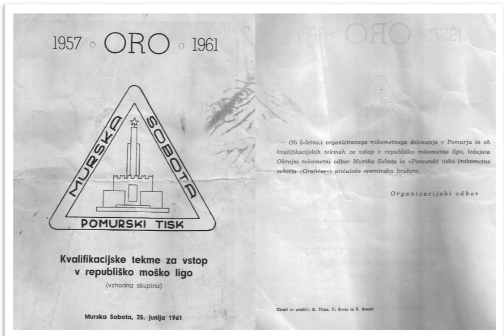
Slika 72: Spominska brošura ob 5-letnici organiziranega rokometnega delovanja v Pomurju in ob kvalifikacijskih tekmah za vstop v republiško ligo