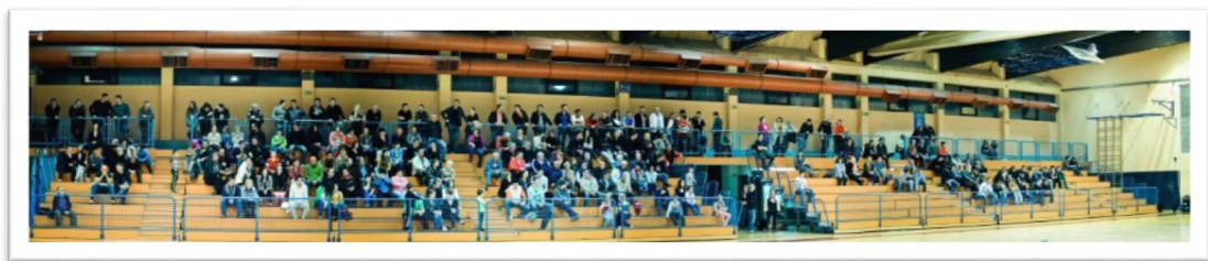
Slika 68: Gledalci na pomurskem rokometnem derbiju leta 2014