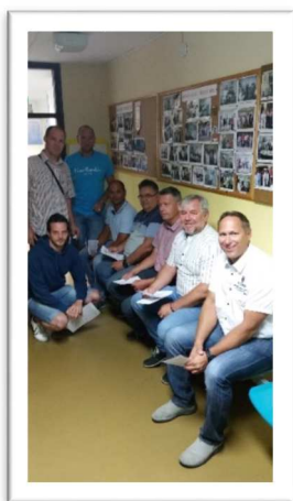
Slika 60: Krvodajalska akcija RK Pomurje 2017

Vodstvo se je v teh zadnji 6 letih trudilo vzpostaviti pogoje za delovanje članske ekipe in ekip mlajših selekcij. Pogoji za delovanje so vzpostavljeni, primanjkuje pa strokovnega kadra, kljub temu, da smo pred nekaj leti v Murski Soboti organizirali izobraževanje za pridobitev naziva trener – pripravnik, katerega se je udeležilo nekaj delavcev iz kluba. Na žalost pa ni želje in veselja za nadaljevanje izobraževanja.