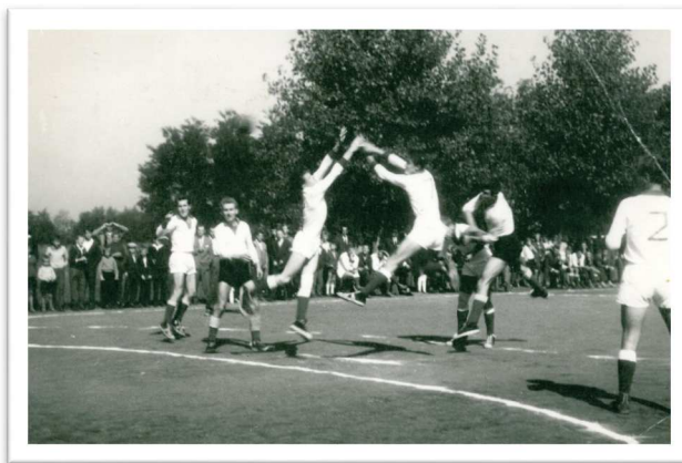
Slika 24: Rokometna tekma iz 60-tih let

Nas vežejo na prvo tekmo odigrano na asfaltu, pa ne na pravem rokometnem igrišču temveč na cesti pred današnjo pošto in banko v Murski Soboti. Tekmo si je ogledala množica gledalcev, nekateri so prvič videli to »športno čudo«, pa večina ne zadnjič, saj so bili obiskovalci navdušeni nad prikazanim. Gole so igralci sami prinesli od današnjega doma TVD Partizan pa do centra mesta, kar na rokah. Nič ni bilo težko.