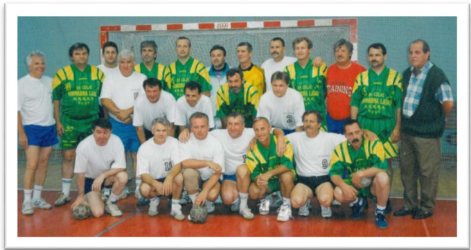
Slika 27: Srečanje veteranov Poleta in Celja Pivovarne Laško, 1996

Ali so vsa ta nekoč lepa in uspešna leta Pomurskega rokometa le zgodovina in SPOMINI ?