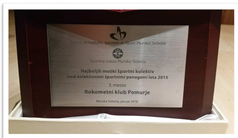
Slika 62: Priznanje Mestne občine Murska Sobota, za leto 2015

Leta 2015 je rokometni klub Pomurje s strani Mestne občine Murska Sobota dobil priznanje za 3. mesto za najboljši moški športni kolektiv med kolektivnimi športnimi panogami leta 2015.