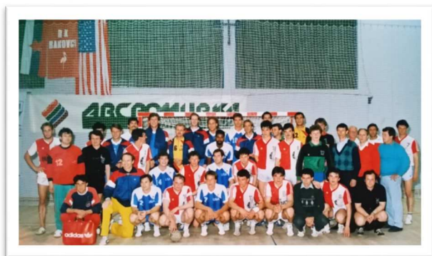
Slika 35: Skupinska slika RK Pomurka Bakovci in olimpijske reprezentance ZDA

V finalu pokala je tako Celje premagalo Pomurko Bakovci z rezultatom 32:19. Tekmo je prenašala nacionalna televizija.