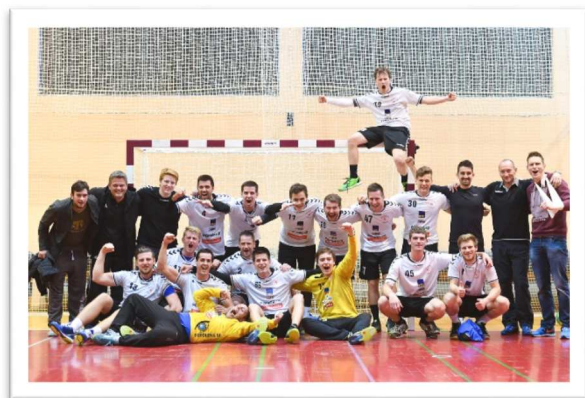
Slika 57: Po tekmi 1/16 finala pokala Slovenije RK Pomurje - RK Radeče 28:26, 26.10.2016