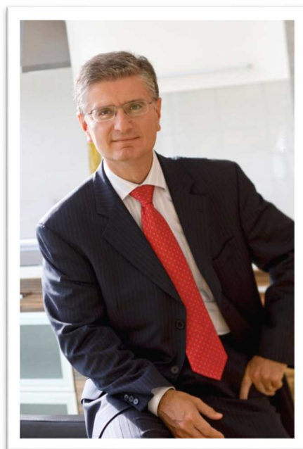
Slika 3: Franjo Bobinac, predsednik Rokometne zveze Slovenije

Zato vam še enkrat iskreno čestitam na častitljivem jubileju, v svojem in v imenu Rokometne zveze Slovenije.