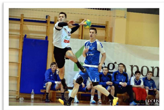
Slika 67: Pomurski rokometni derbi, 2014