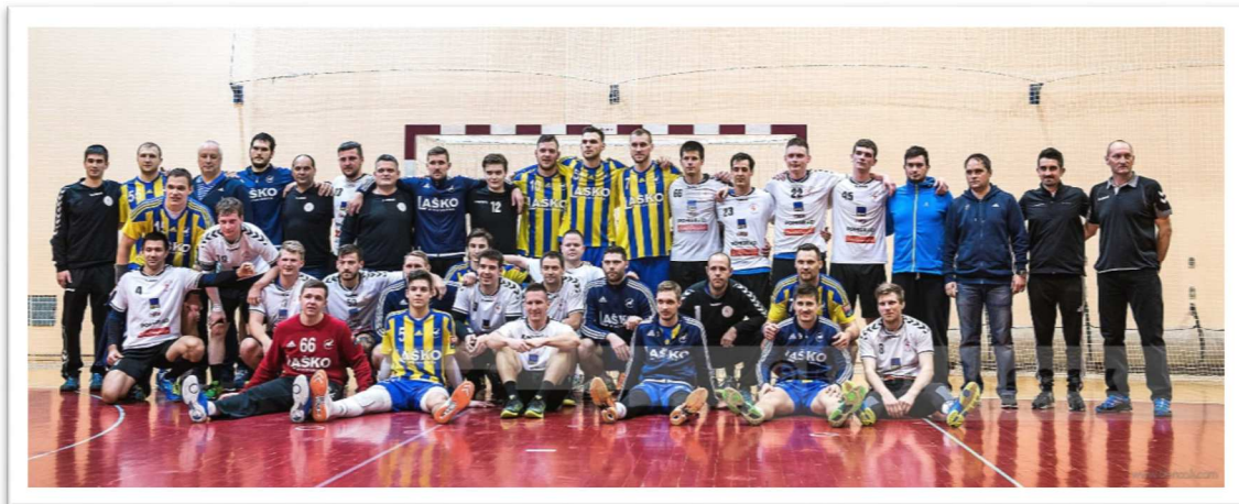
Slika 56: Skupinska slika RK Pomurje in RK Celje Pivovarna Laško po tekmi 1/4 finala pokala Slovenije, 21.12.2016

pomurskega rokometna, morali priznati premoč najboljši slovenski rokometni ekipi RK Celje Pivovarna Laško. To je bil pravi rokometni praznik v Murski Soboti. Na poti do ¼ finala je ekipa premagala Kronos iz Logatca in dve ekipi iz 1B lige, Radeče in Brežice.