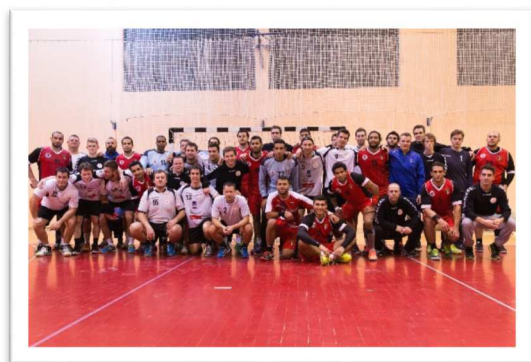
Slika 66: Skupinska slika po tekmi RK Pomurje - Egipt (december 2014)