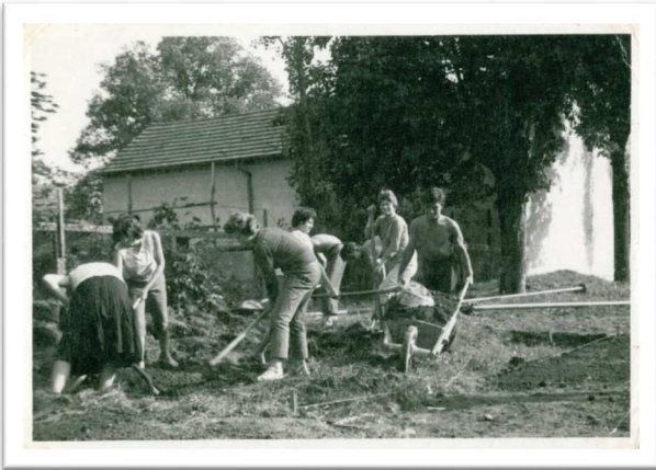
Slika 22: Izgradnja igrišča TVD Partizan v Murski Soboti

Ustanavljali so nove tekmovalne lige, od občinskih, medobčinskih, okrajnih, sindikalnih, šolskih, mladinskih ter pionirskih. Tudi članice so se zelo aktivno vključevale in tekmovali v svojih ligah in kategorijah.