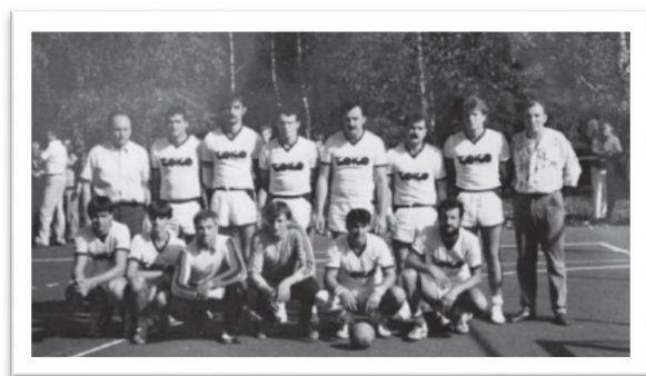
Slika 44: RK TOKO Črenšovci