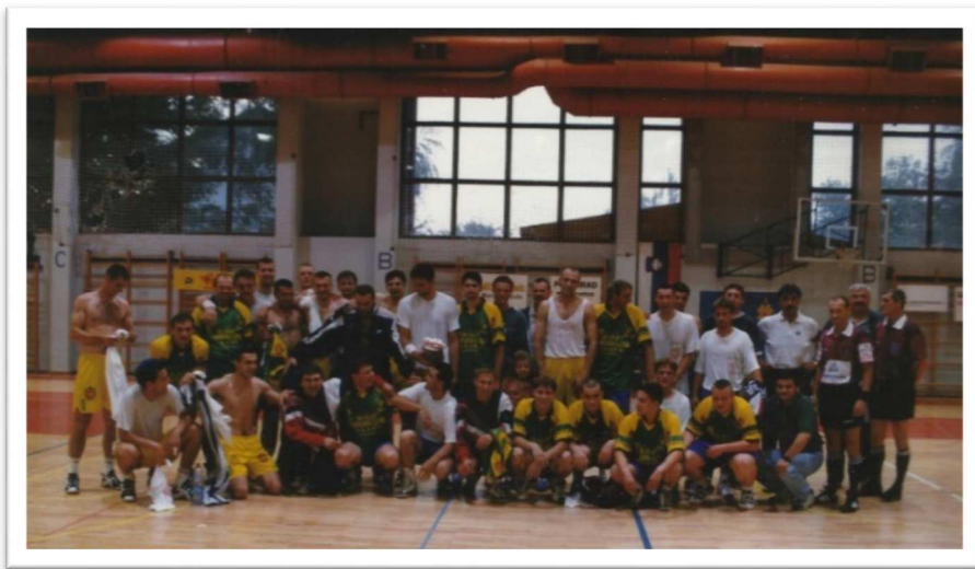
Slika 18: Tekma ob 40. letnici RK Polet: RK Polet - RK Celje Pivovarna Laško, 20.6.1998;

Pred sezono 1998/99 se kluba RK Krog in RK Bakovci združita in imata dve ekipi v 2. državni ligi. Prva doseže 1. mesto ter napreduje v 1.B ligo, druga pa osvoji zadnje mesto. Polet je zaključil tekmovalje na 2., Radgona pa na 5. mestu.