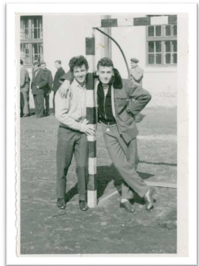
Slika 28: Druženje !