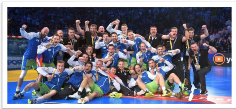
Slika 7: Veselje reprezentance Slovenije po bronasti medalji na svetovnem prvenstvu, Francija 2017

Leta 2004 je Slovenija organizirala evropsko prvenstvo za člane (Celje, Koper, Ljubljana, Maribor, Velenje), kjer so rokometiši osvojili srebrno medaljo in se še drugič uvrstili na olimpijske igre.