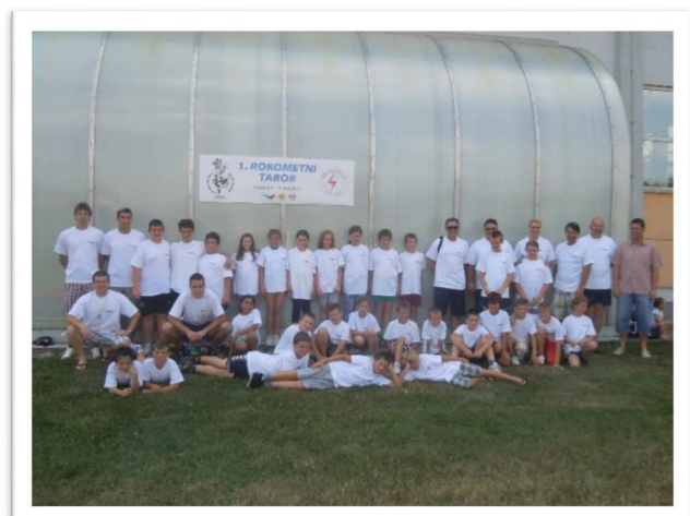
Slika 55: Rokometni tabor 2012