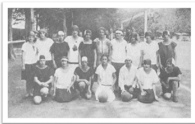
Slika 25: Murine igralkе hazene, nekje med 1925 in 1929

Na roket, ki so ga igrale članice davnega leta 1924, imenoval se je hazena. Igrale so le dekleta, pravila, igrišče in goli pa so bili nekoliko drugačni od sedanjih. Danes teh igralk ni več med nami, gre pa jim vsa zahvala, saj so prve orale ledino celotnega ženskega športa. Lahko pa jih vidimo na starih fotografijah in časopisnih člankih iz katerih je razvidno, da so bile izredno uspešne, saj so bile v takratni državi med najboljšimi.