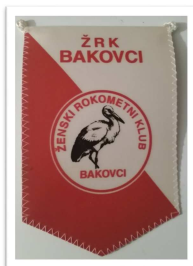
Slika 41: Grb ŽRK Bakovci