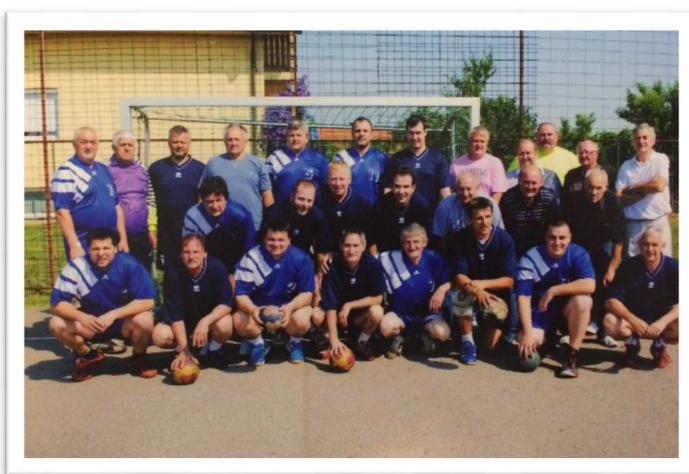
Slika 52: Srečanje veteranov Kroga in Monoštra, 2016

V sezoni 1998/99 sta začeli sodelovati ekipi Kroga in Bakovec. Člani so se uvrstili v 1.B ligo, z ostalimi mlajšimi selekcijami pa so prav tako tekmovali v republiških ligah.