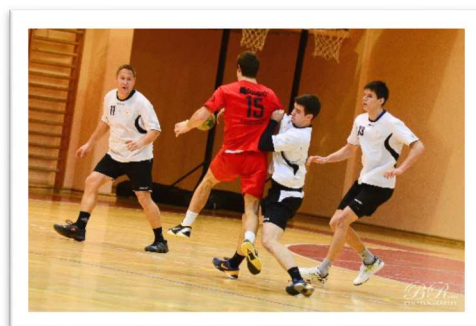
Slika 70: Utrinek iz tekme iz sezone 2012/13