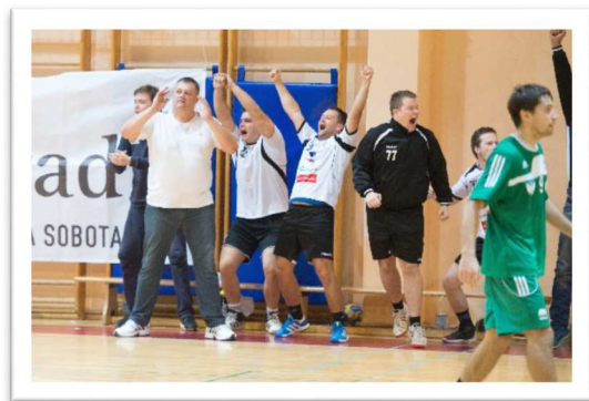
Slika 69: Veselje ob zmagi v sezoni 2014/15