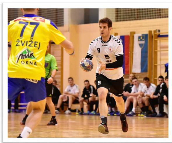
Slika 4: Tekma 1/4 finala pokala Slovenije med RK Pomurje in RK Celje Pivovarna Laško, 21.12.2016