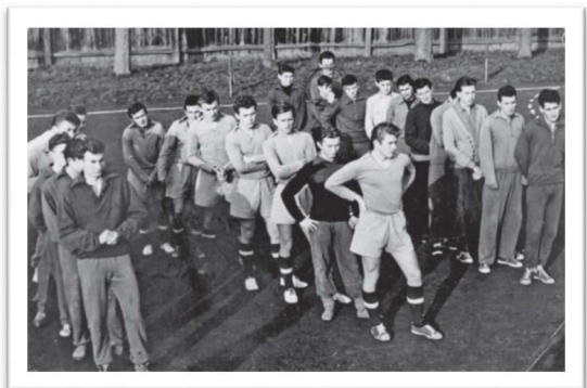
Slika 9: Moštva 1. rokometnega turnirja v Murski Soboti (25.11.1957)

Že v naslednjem letu (1958) so ponovno organizirali pomursko prvenstvo, kjer se je tekmovalju pridružila še beltinska šola.