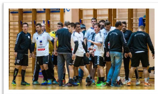
Slika 65: Ekipe Pomurja na tekmi 1. kroga v sezoni 2016/17