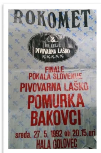
Slika 34: Plakat finalne tekme med RK Celje Pivovarna Laško in RK Pomurka Bakovci

V tej sezoni so v domači dvorani izgubili samo enkrat proti Kolinski Slovanu. Še kasnejši prvak Celje Pivovarna Laško se je moral zadovoljiti samo s točko. V enem od športnih časopisov je nastal zanimiv naslov: »doma volkovi, v gosteh ovčke«.