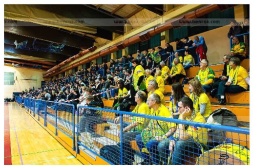
Slika 20: Polna dvorana OŠ III, 1/4 finala pokala Slovenije, RK Pomurje - RK Celje Pivovarna Laško, december 2016

Od 2007 do 2011 se za primat v Pomurju borita Radgona in Pomurje. Ekipa Pomurja nekoliko stagnira in vodstvo kluba se odloči, da poišče pomoč pri bivših rokometnaših, predvsem na organizacijskem in finančnem področju. Tako od sezone 2011/12 naprej pod novim vodstvom Pomurje počasi napreduje in začne dosegati nekoliko boljše končne dosežke. V zadnji sezoni 2016/17 je Pomurje doseglo 6., Radgona pa 8. mesto. Zelo dobro pa so obiskani pomurski derbiji med Pomurjem in Radgono.