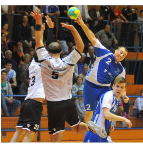
Slika 19: Pomurski rokometni derbi: RK Pomurje - RK Arcont Radgona 26:25, 29.3.2014