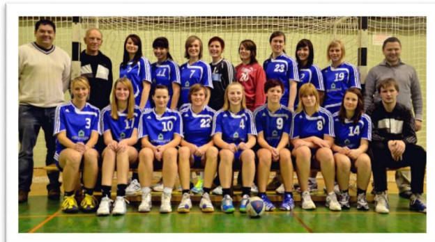
Slika 42: Ekipa ŽRK Millennium iz leta 2012