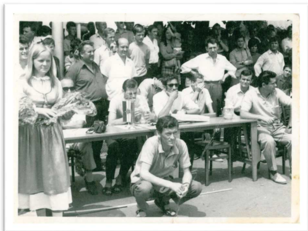
Slika 13: Državno prvenstvo v rokometu za mladinke. Za organizacijo tega prvenstva so bile izrečene same pohvale.