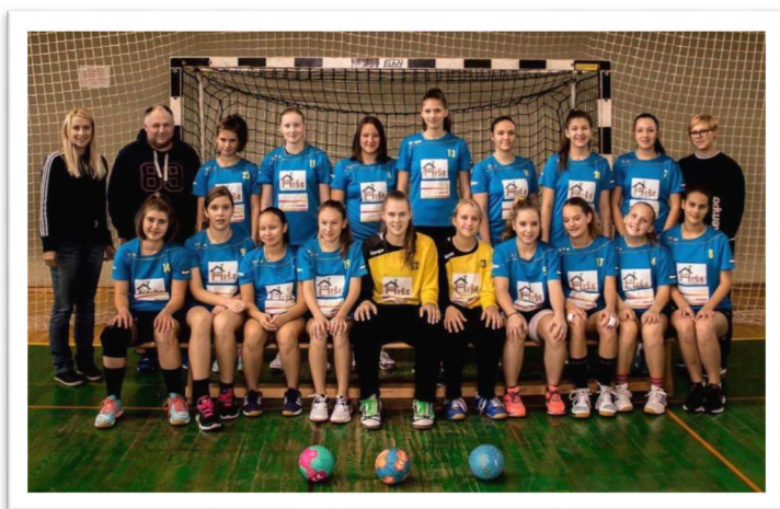
Slika 43: Ekipa starejših deklic ŽRK Millennium iz leta 2017