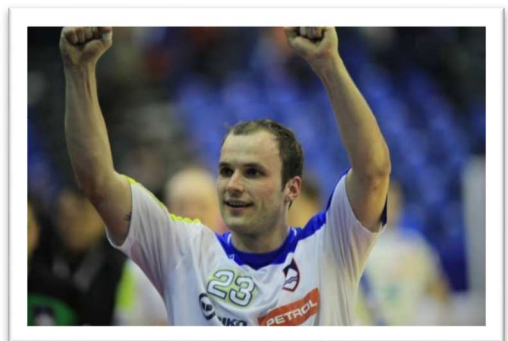
Slika 8: Uroš Zorman, eden najuspešnejši slovenskih rokometašev

Veliko pa je slovenskih reprezentantov, ki so z igranjem v tujini, tudi večkrat, osvojili največ kar se v rokometu, na klubski ravni, lahko osvoji – ligo prvakov.